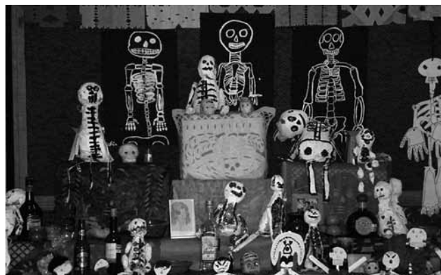
Unser Altar zum Dia del Muertos (1. November)

Auswahl des Frühstücks könnte ungewohnter nicht sein. Neben den bekannten Apfelstücken essen die Kinder Mexican Food, Pudding, Schokoladenriegel, Salat mit Sauce, Joghurt, Spaghetti und statt mit meinem heissgeliebten Schweizer Aromat wird mit Chilipulver gewürzt.