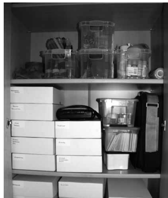
Aufgeräumter Schrank im Kindergarten

Auch Feng-Shui ist im Kindergarten möglich. Zwar nicht auf jedes einzelne Kind zugeschnitten, aber der Raum lässt sich nach Feng-Shui einrichten. Wer es genau machen möchte, braucht dazu eine Raumanalyse, bei den Farben, Materialien und Formen eine Rolle spielen. Dazu muss nicht der ganze Kindergarten neu eingerichtet werden, sondern oft lässt sich mit den vorhandenen Möbeln